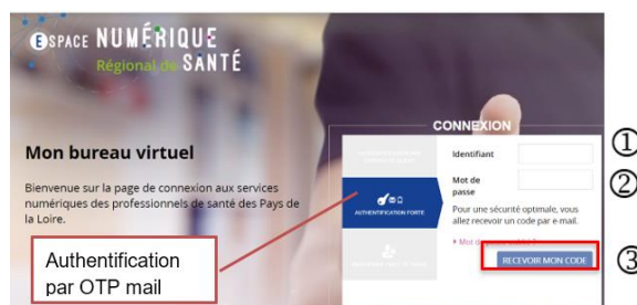
Figure 2 : Connexion OTP mail